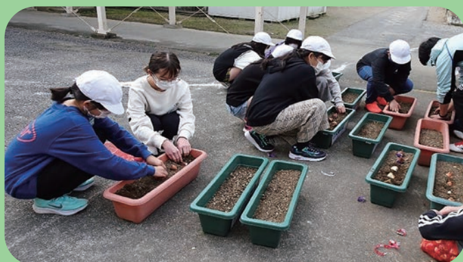
家庭募金緑化事業