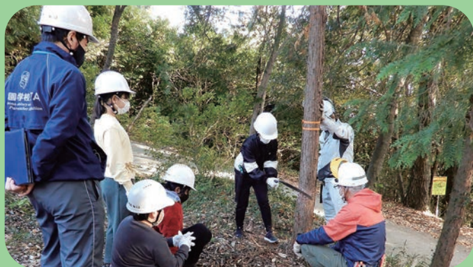
緑の少年団活動(間伐体験)