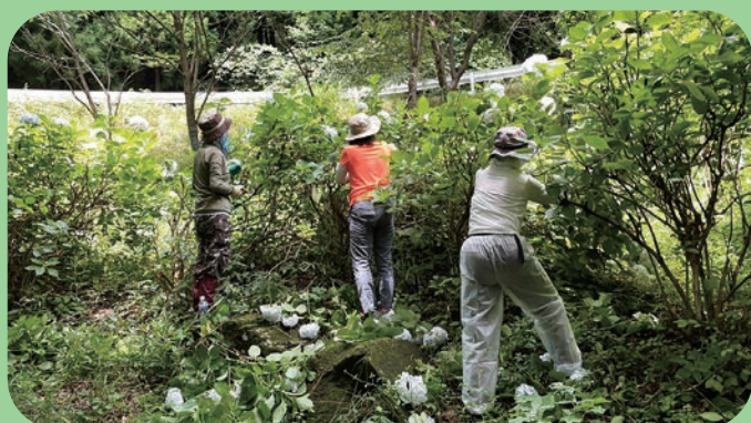
ボランティアによる整備