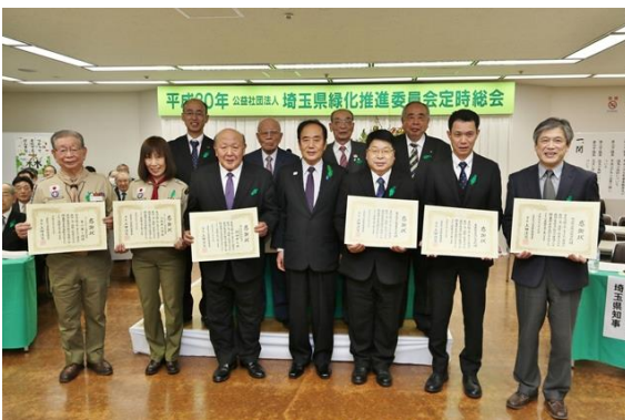
29年度緑の募金協力者