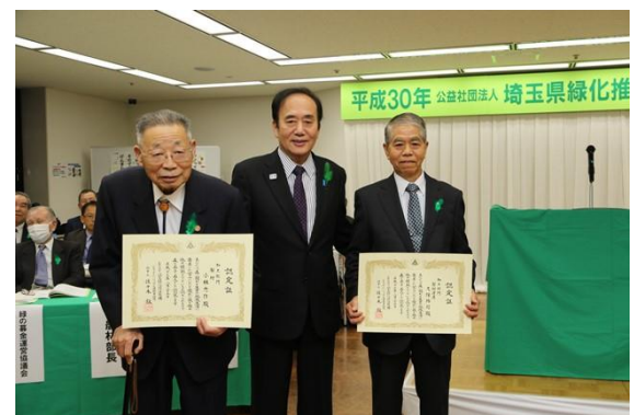
森の名手・名人の認定証伝達