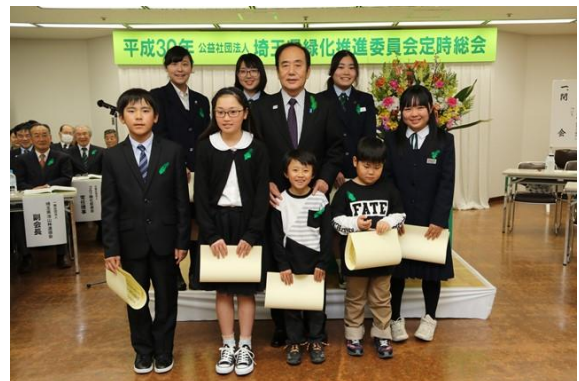
29年度郷土緑化運動ポスター原画コンクール